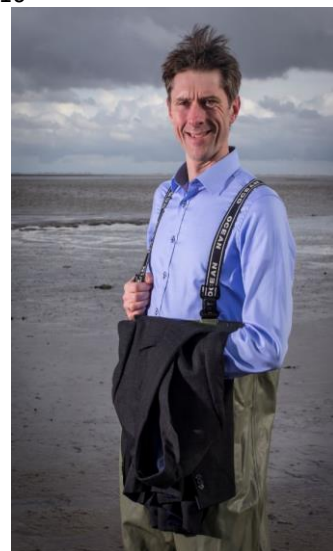
Martin Baptist Wageningen Maritime Research