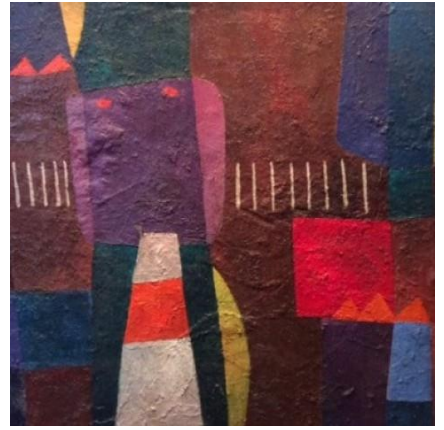
Schilderij Boele Bregman, Museum Belvédère